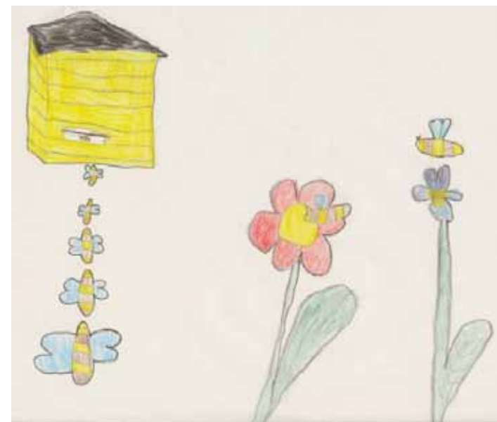
Snart är det vår...